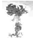
图4 中国第一颗 原子弹爆炸成功