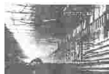
图5 鞍山大型 轧钢厂

(2) 在中国共产党领导下,新中国取得了巨大成就。仿照下表示例,对上述图片进行归类。(4分)