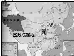
图 1 元朝疆域图

1727 年，清朝开始设立驻藏大臣，作为中央政府的代表长驻西藏，同达赖、班禅共同管理西藏。乾隆皇帝制定“金瓶掣签”制度，规定活佛转世的人选，必须用中央颁发的金奔巴瓶抽签决定。